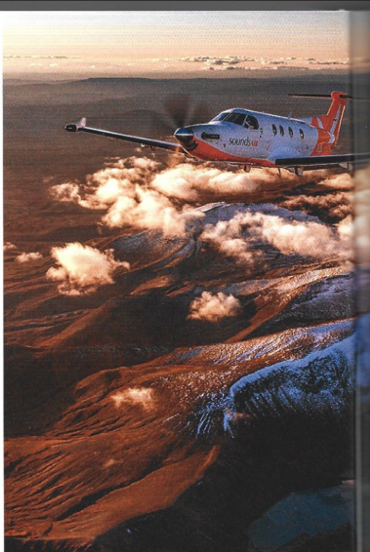
Die atemberaubende Aussicht des Fotografen The photographers' incredible view

Endlich geht's los! Ich bin die einzige Passagierin im PC-12 und habe freie Platzwahl. Als wir auf die Startbahn rollen, taucht der Hubschrauber neben uns auf, Jon