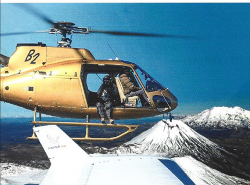
Jon sitzt fürs Fotografieren im offenen Hubschrauber Jon sits in the open helicopter for taking pictures

sollte, was sein bevorzugter Winkel für ein optimales Foto ist. Eine gewisse Schräglage des Flugzeugs trägt ebenfalls zum perfekten Bild bei. Es wird zwei Foto-shootings geben, das erste gegen Mittag und ein zweites im Licht des Sonnenuntergangs.